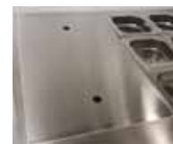
GN 1/1 SKYDDSPLATTA