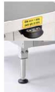
ELEKTRISK HYDRAULISK JUSTERING