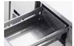
BAS KOMPLETT I ROSTFRITT STÅL