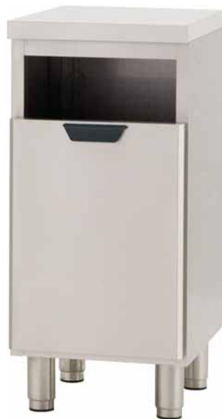
B55/N40W-T med topp