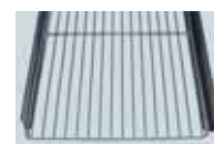
TRÅDHYLLA MED SKENOR