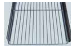
TRÅDHYLLA MED SKENOR