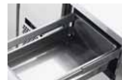
BAS KOMPLETT I ROSTFRITT STÅL