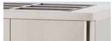
DELNINGSRAM FÖR GN BEHÅLLARE