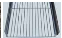
TRÅDHYLLA MED SKENOR