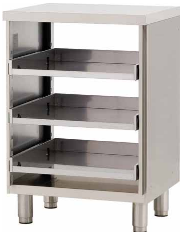
B55/SC-600N-T med topp