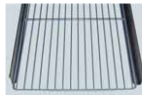
TRÅDHYLLA MED SKENOR