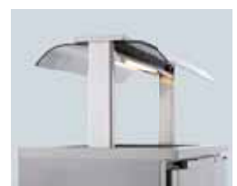
UNDERDEL MED HOSTSKYDD OCH BELYSNING

OBS! Priser för tillbehör gäller endast vid köp av en komplett produkt, dvs. skåp plus tillbehör.