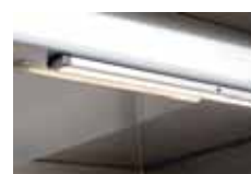
LED-LAMPA MED SENSOR