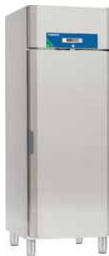
Future C 722 E