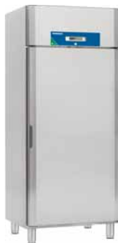
Future C 720 E