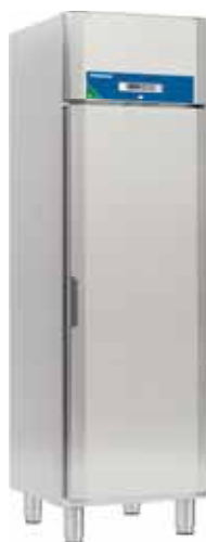
Future C 520 E