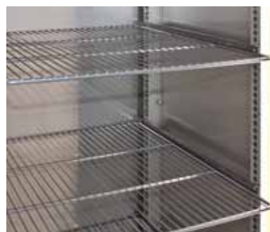
Trådhyllor i rostfritt stål