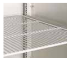
TRÅDHYLLA MED PULVERFÄRGBELÄGGNING