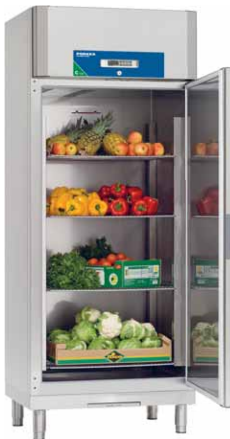
Future C 730 E