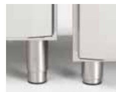
KORTA BEN 70/105 MM