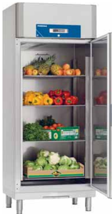
Future Plus C 730

Porkka Future Plus-serie med skåp för användning i professionella kök och matberedningsområden, tillverkas av material i yttersta kvalitet för att säkerställa långvarig prestanda i krävande förhållanden.