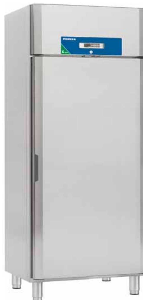
Future C 720 E