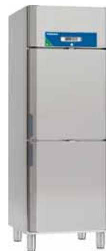
Future C 722-2 E