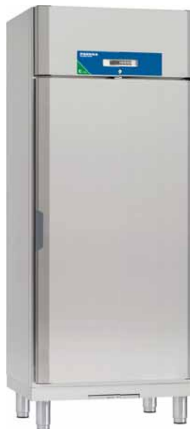
Future C 730 E